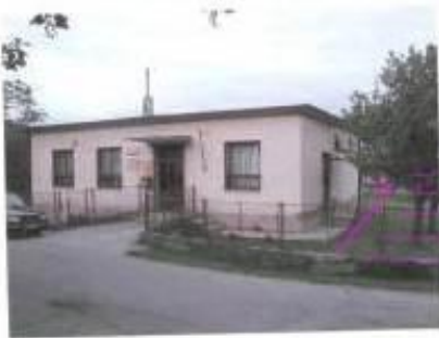
Fotodokumentácia Pošta - Plavecký Mikuláš