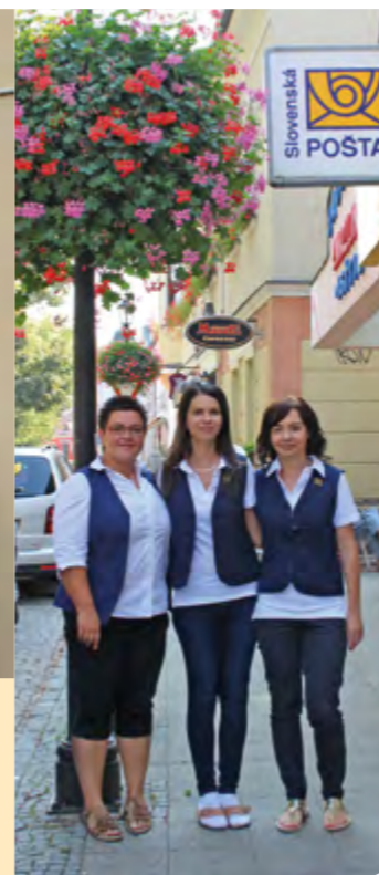
Pred budovou pošty Skalica 1.