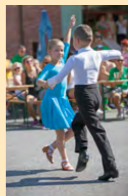
Malí tanečníci nám tiež predvedli svoje pohybové nadanie.