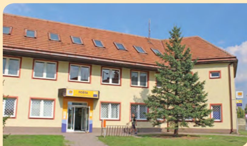
Budova pošty v Šaštine.