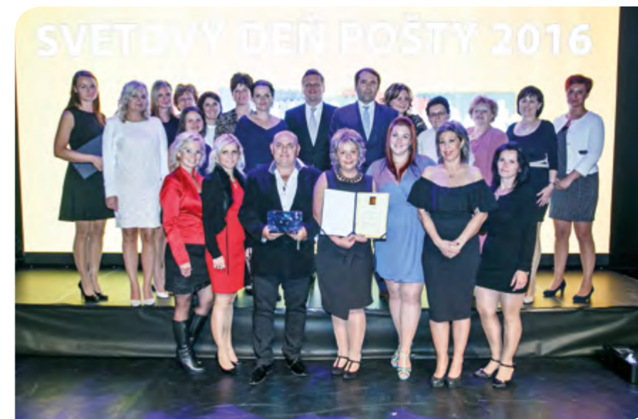
V kategórii Kolektív vyhrala Hlavná pošta Dunajská Streda.

Zabezpečuje starostlivosť o viac ako 140 klientov, ktorých výnosy sú približne dva milióny eur. Svoje povinnosti si plní veľmi svedomito, prichádza s novými návrhmi na riešenie úloh a nachádza praktické riešenia problémov. Skúsenosti, ktoré nazbierala prácou v SP na iných pozíciách, medzi inými aj na zákazníkovi serise, je veľkým prínosom pre celý tím. Pomáha