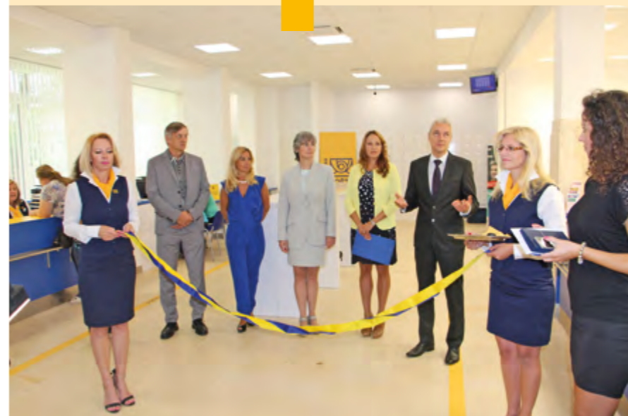
Slávnostné otvorenie pošty v Kežmarku.

Slovenská pošta otvorila v polovici septembra zrekonštruovanú poštu v pamiatkovej zóne Kežmarku. Po necelých ôsmich mesiacoch stavebných a rekonštrukčných prác tu budú môcť obyvatelia Kežmarku, okolitých obcí ale aj návštevníci využívať poštové, balíkové a finančné služby v nových moderných, klimatizovaných a bezbariérových priestoroch.