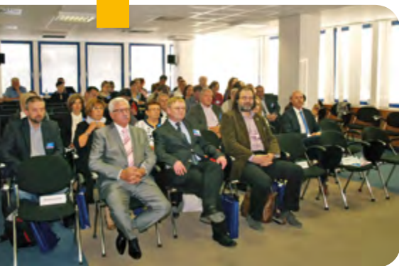
Pohľad na účastníkov vedeckej konferencie

V budove Slovenskej pošty na Partizánskej ulici v Banskej Bystrici sa 27. septembra 2016 uskutočnila druhá medzinárodná vedecká konferencia pod názvom História a súčasnosť zbierok a zberateľstva.