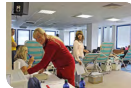
Táto dáma všetkých, čo to potrebovali, vedela upokojiť.

„V živote je mnoho situácií keď sa ľudia dostanú na prah života a smrti. Ak prežili, ich život sa pravdepodobne dostal do rúk iných. Do