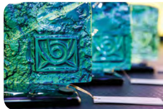
Ceny generálneho riaditeľa slovenskej pošty pre víťazov v jednotlivých kategóriách.