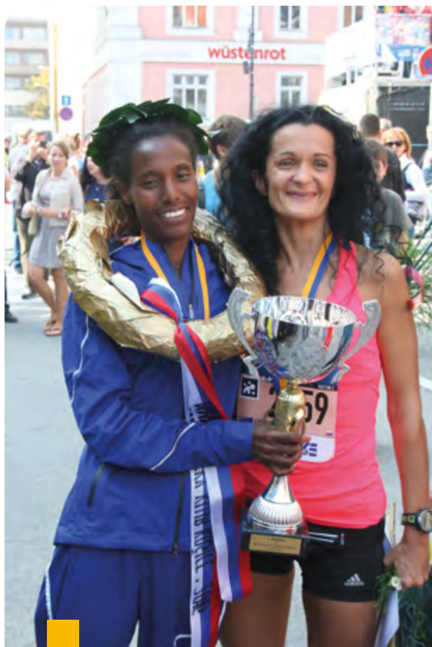
redakcia, foto: Zuzka Kršáková