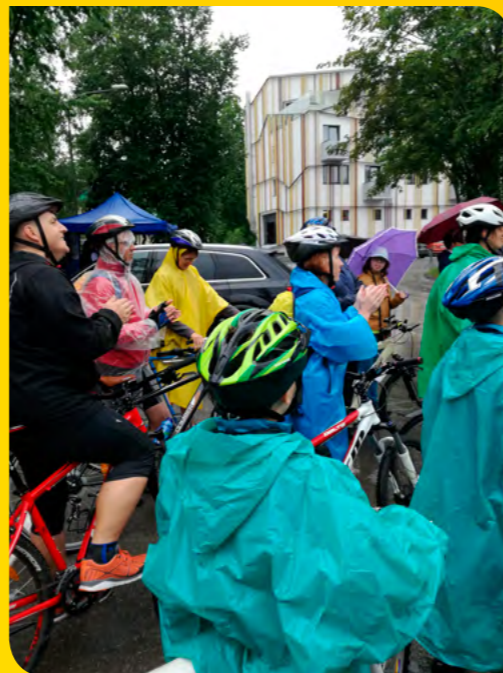
Momentky z finálnej cyklistickej etapy vedúcej popod Vysoké Tatry v daždivom počasí.