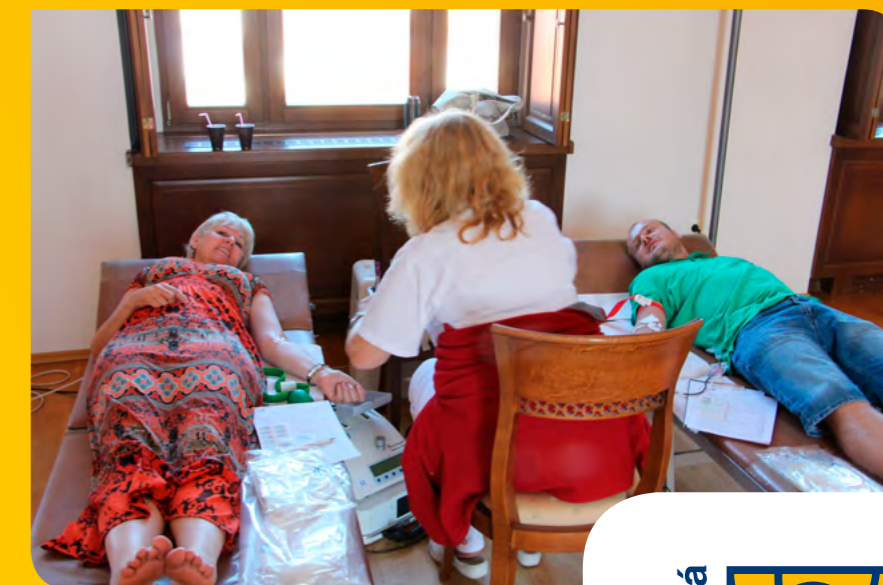
Poštárska kvapka krvi na Hlavnej pošte v Bratislave.

P omoc druhým má rôzne podoby. Niekedy stačí zájsť do zasaďačky a chvíľu si poležať. Presne takto nejaká sa to u nás na námestí SNP v Bratislave deje počas mobilného odberu krvi už od roku 2010. Nateraz posledný odber sa uskutočnil koncom júna. Napriek horúcemu letnému dňu a dovolenkovému obdobiu mnohí naši kolegovia neváhali a prišli darovať tú najcennejšiu tekutinu. Všetkým darcom veľmi pekne ďakujeme. A tým, ktorí sa nemohli zúčastniť alebo ešte nenabrali dostatočnú odvahu, oznamujeme, že budú mať príležitosť zasa na jeseň.