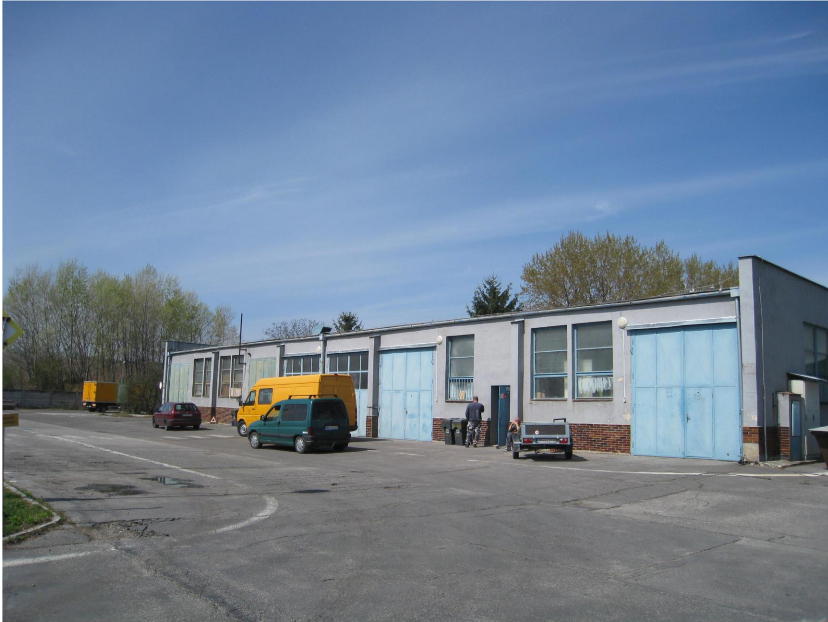
Sklad, dielňa, garáže na parc. č. 1681