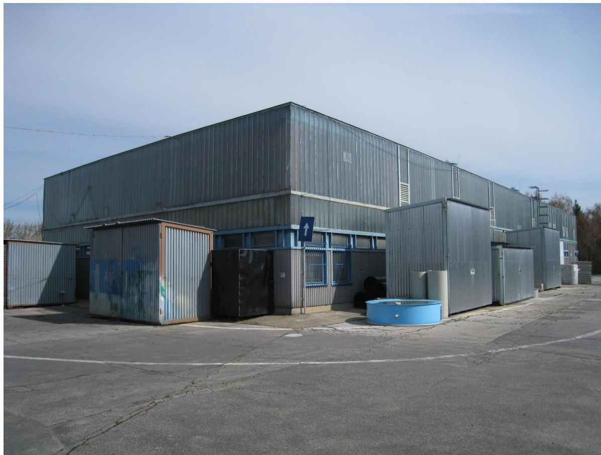
Ser. stanica mob. Simplex na parc. č. 1679