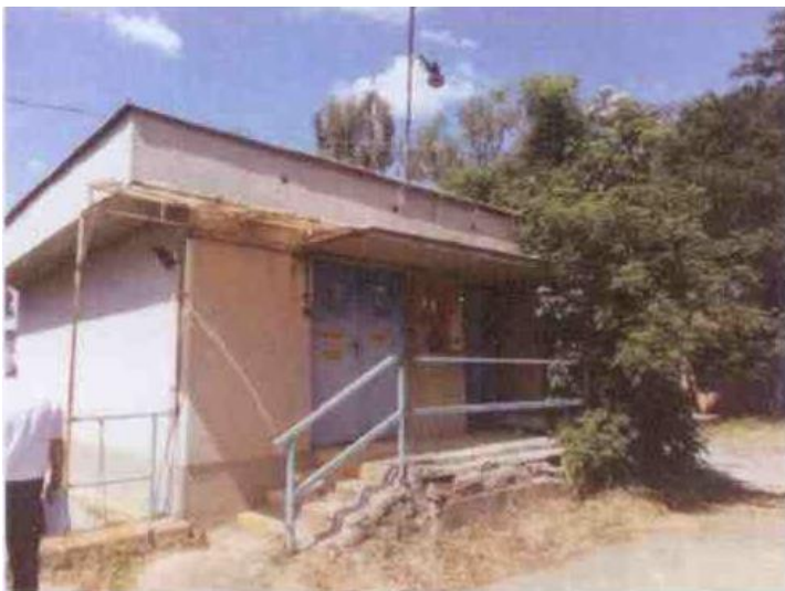
Prečerpávacia stanica na parc. č. 1682