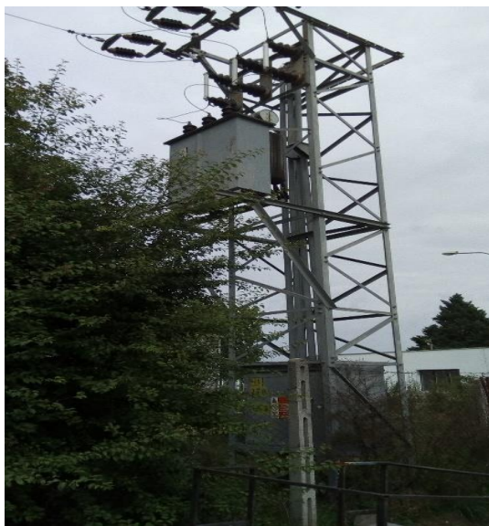
TS 0051-270, 22/0,4kV –stožiarová trafostanica 1x250,0kVA vo dvore objektu