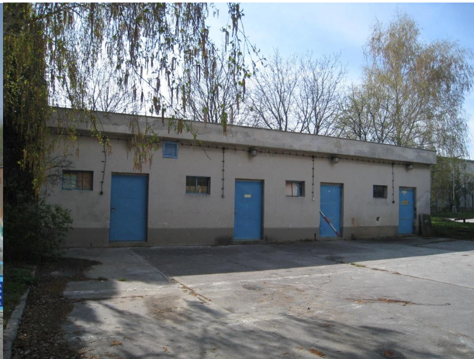
Sklad na parc. č. 1680