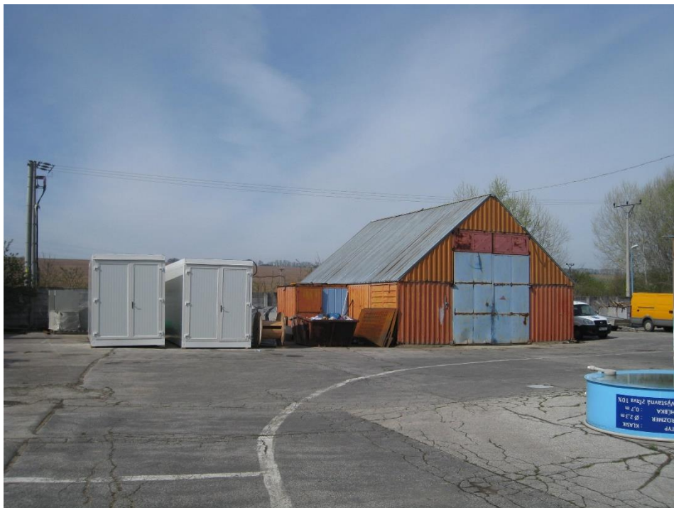
Stanica technickej kontroly na parc. č. 1678